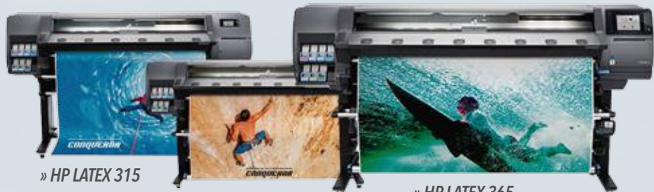
» HP LATEX 315

Descripción: Imprime en sustratos para señalización tradicional y muchos más, hasta 1,63 m (64 pulgadas). Dimensiones: 2561 x 840 x 1380 mm Peso: 208 kg