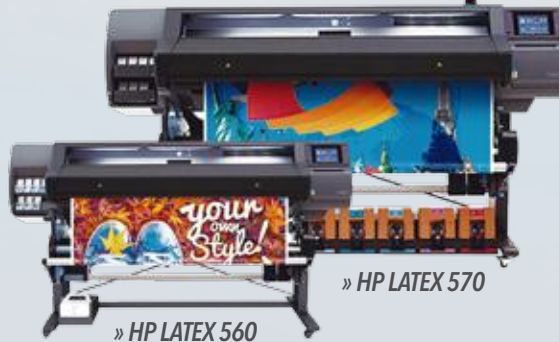
» HP LATEX 560

Descripción: Aumente su capacidad con una impresora mejorada para la gestión de flotas. Productividad elevada con velocidades de impresión elevadas y eficiencia en los costes y los flujos de trabajo. Dimensiones: 2560 x 792 x 1420 mm Peso: 250 kg