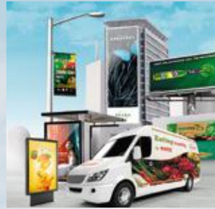
» HP LATEX 365